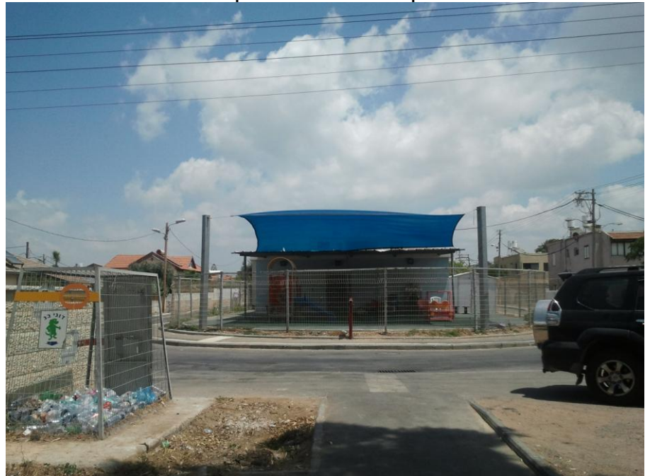
חצר המשחקים של הגן

רחוב אברבנאל מקיף את גן שלדג משלושת צדדיו (הרחוב מתעקל בצורת פרסה). בתמונה רואים את חצר הגן ומאחוריה מבנה הגן.